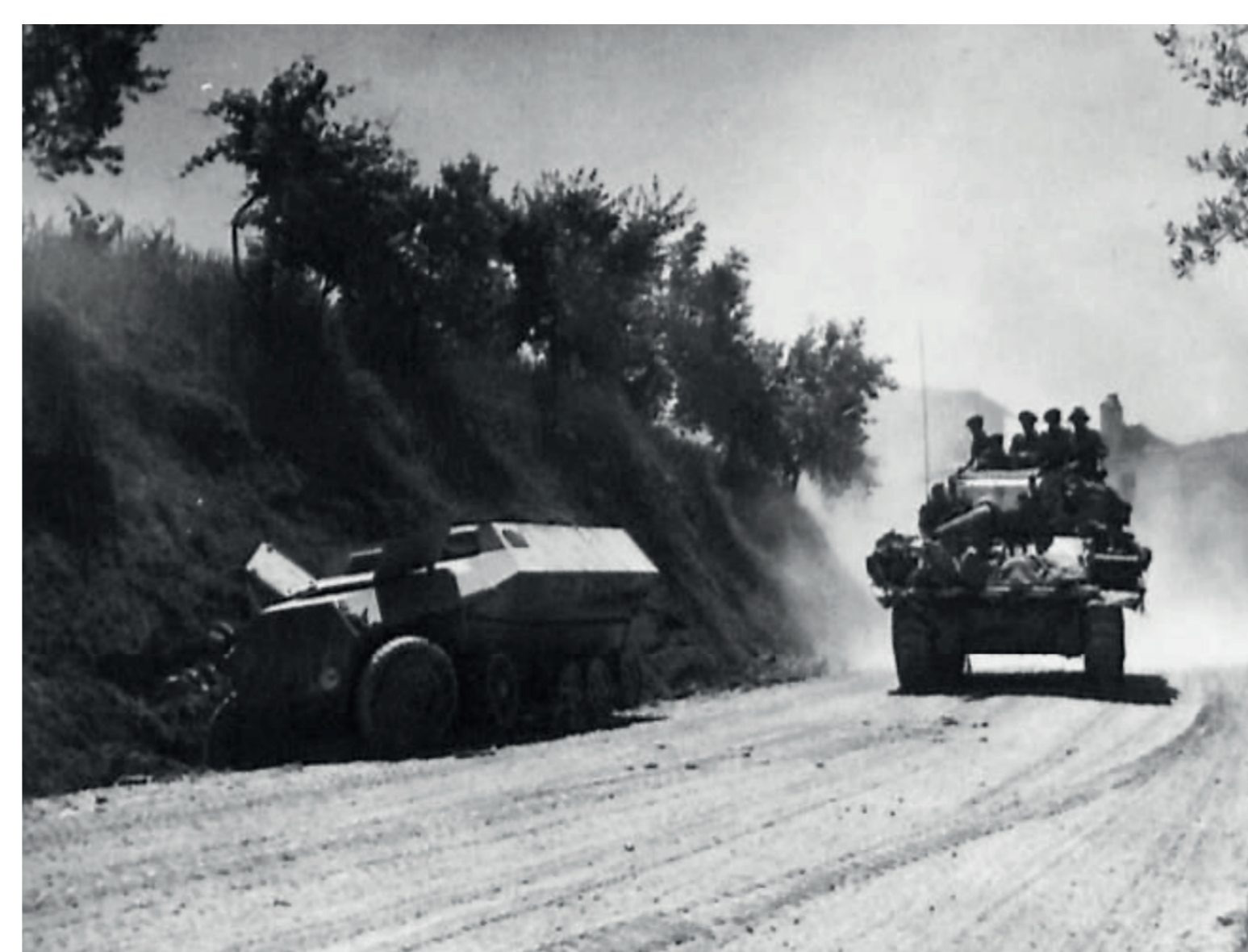
Tank britannico in azione

Il Corpo di spedizione francese, reduce dello sfondamento di Cassino, fu il primo contingente alleato a entrare, il 15 giugno 1944, nel territorio senese; di lì a poco lo seguirono i britannici dell'VIII armata (a est) e gli statunitensi della V lungo le estreme propaggini occidentali della provincia.