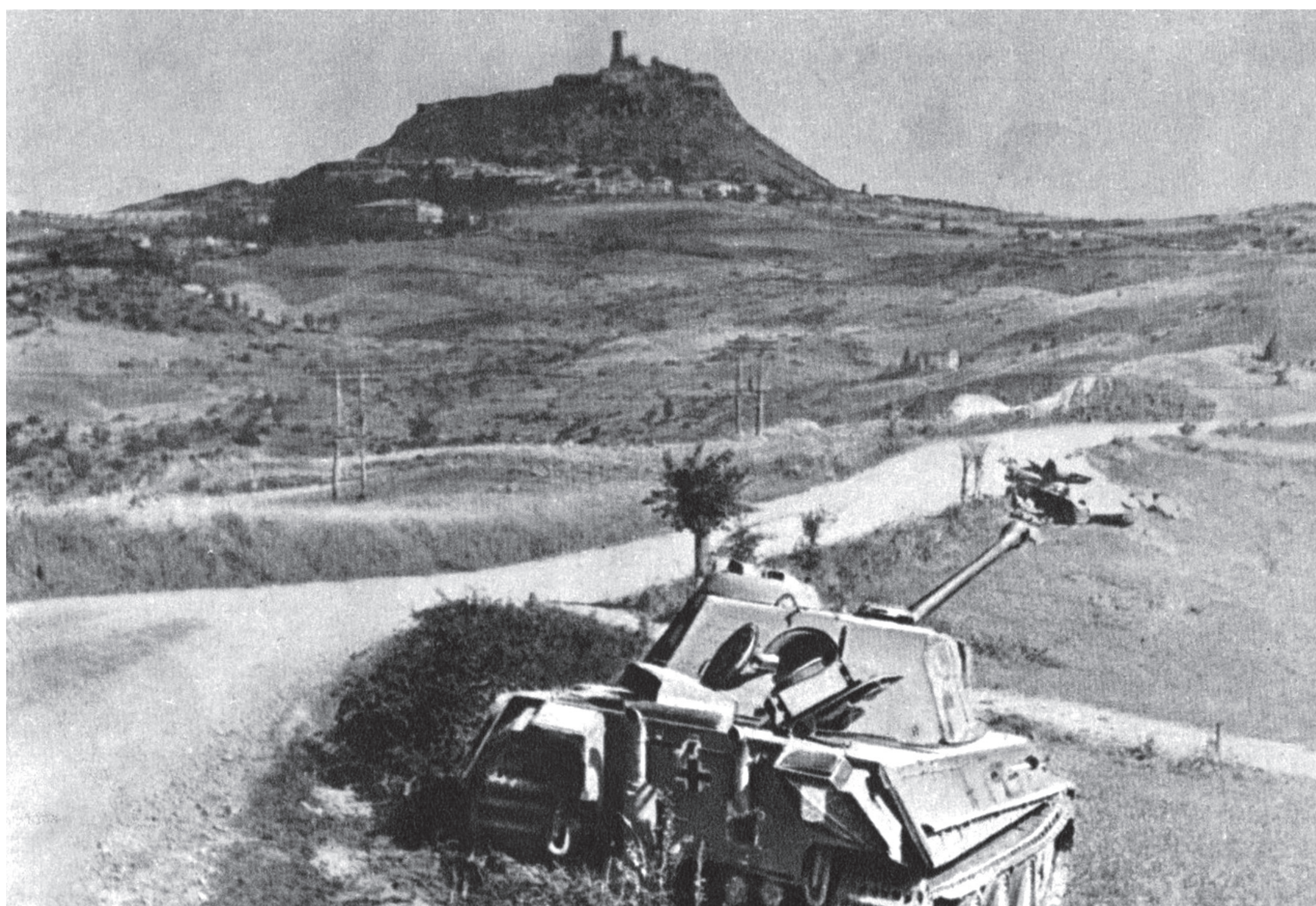
Panzer tedesco distrutto dopo la battaglia di Radicofani

In varie località (Cetona, Abbadia S. Salvatore, Rapolano) le truppe alleate vennero precedute dai partigiani che svolsero funzioni di guida, perlustrazione, individuazione di cecchini e guastatori tedeschi.