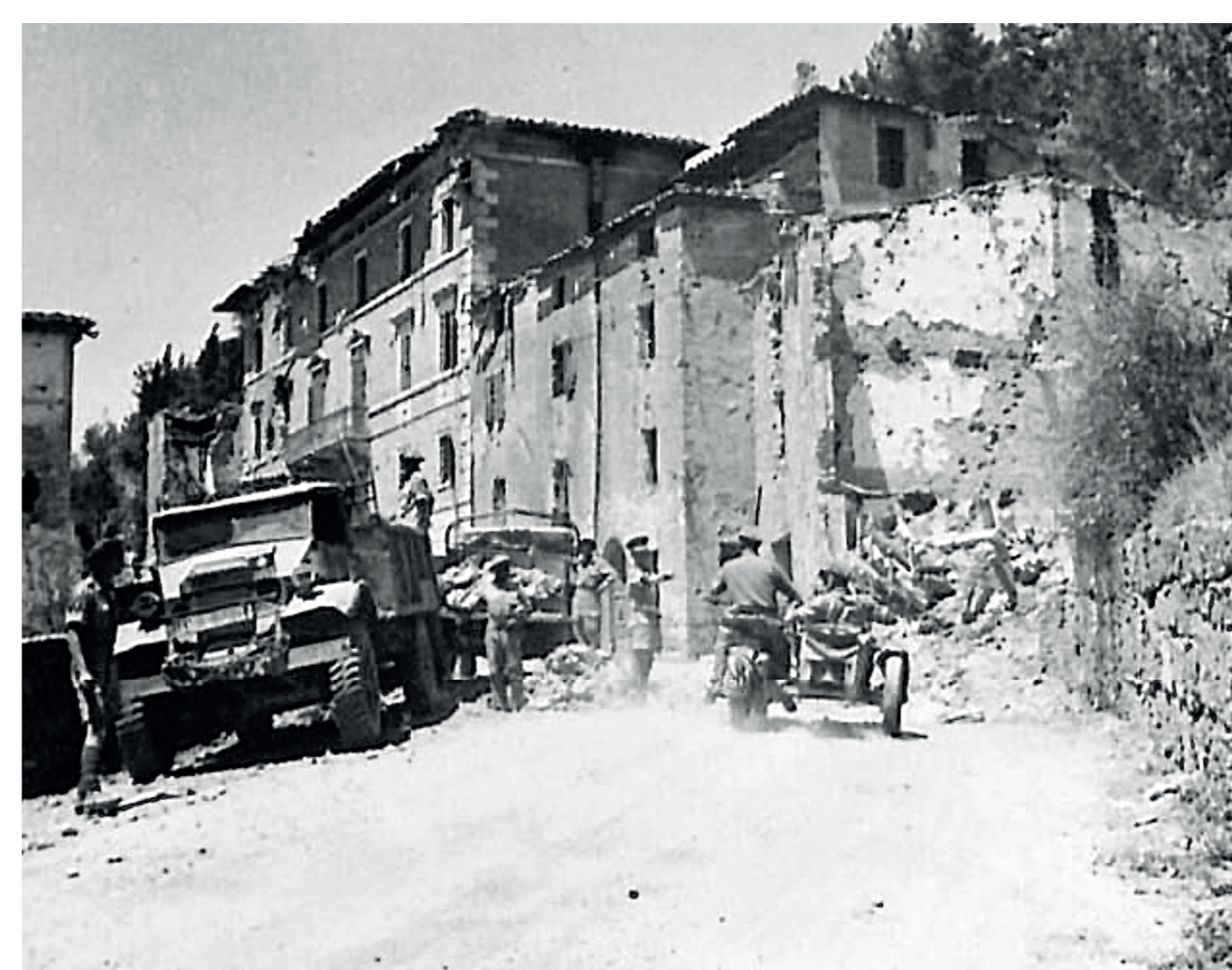
Pattuglie alleate a Chiusi

— VIII Armata britannica - - - - - Corpo di spedizione francese in Italia ..... V Armata statunitense